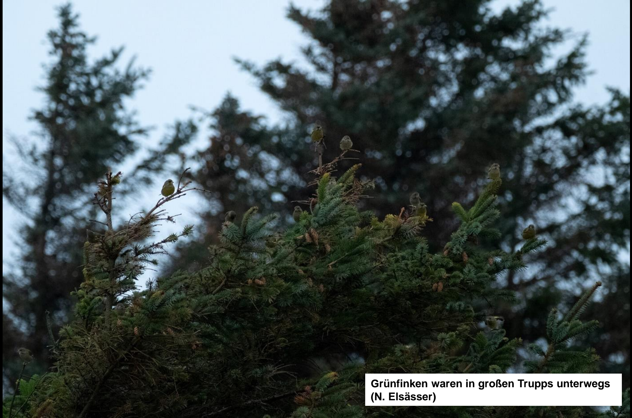
Grünfinken waren in großen Trupps unterwegs