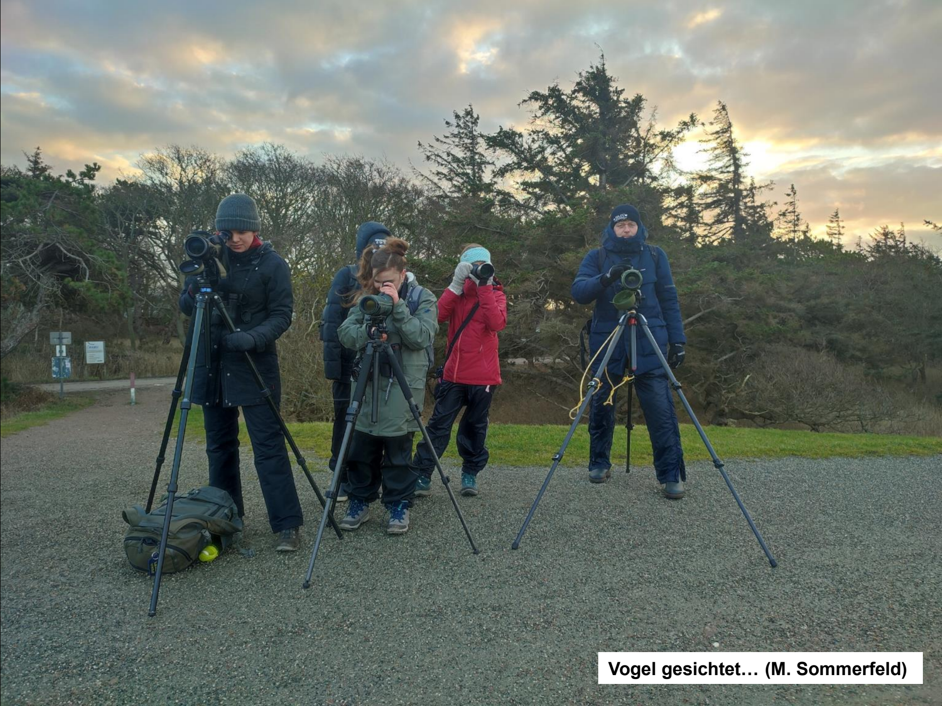
Vogel gesichtet... (M. Sommerfeld)