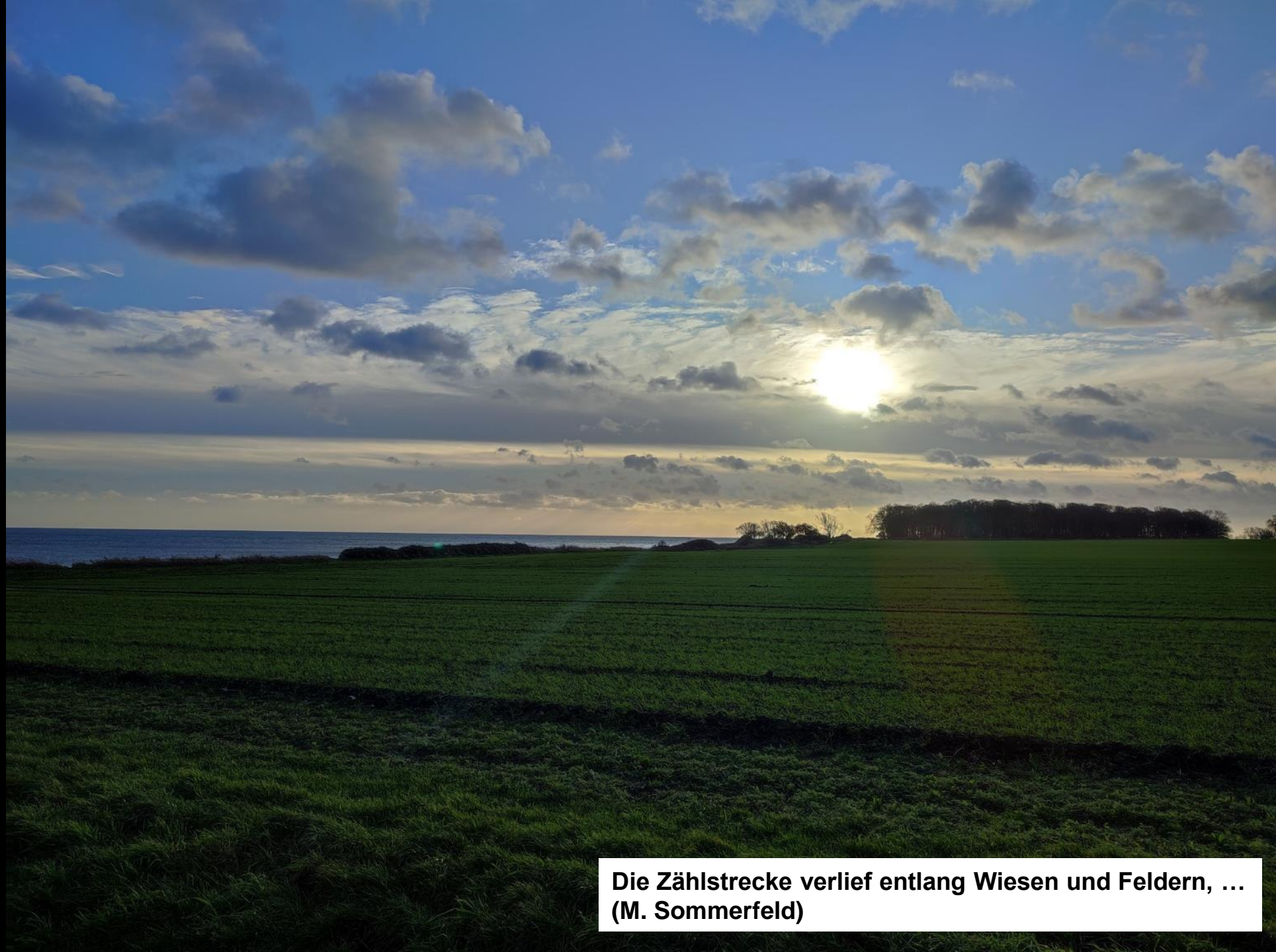
Die Zählstrecke verlief entlang Wiesen und Feldern, ... (M. Sommerfeld)