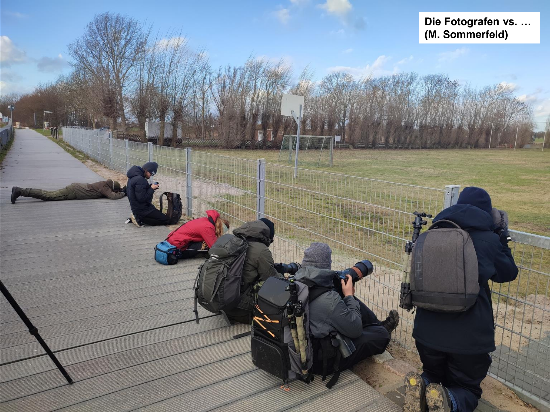
Die Fotografen vs. ... (M. Sommerfeld)