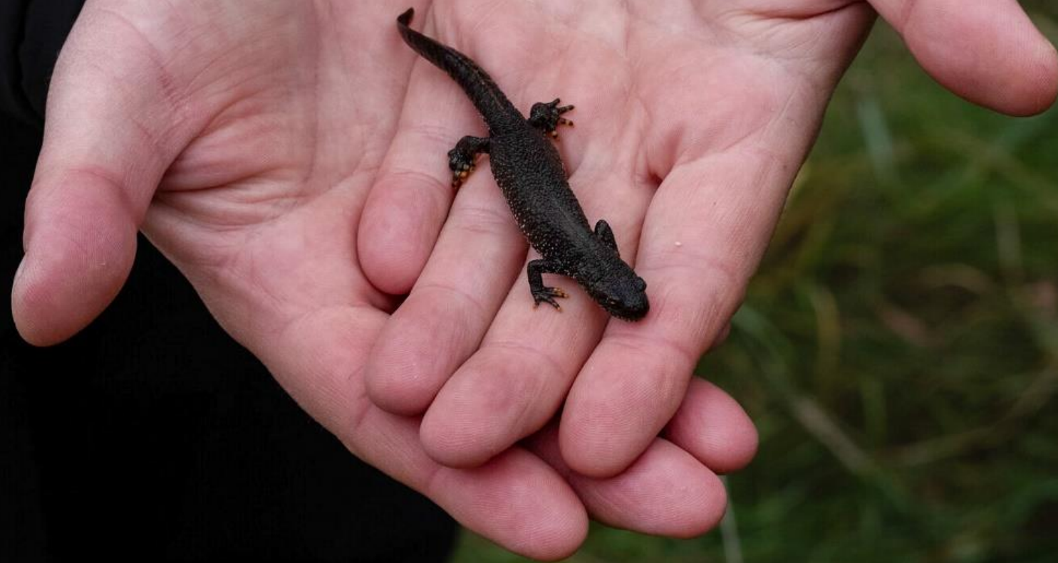
Im Gras fanden wir sogar einen Teichmolch (N. Elsässer)