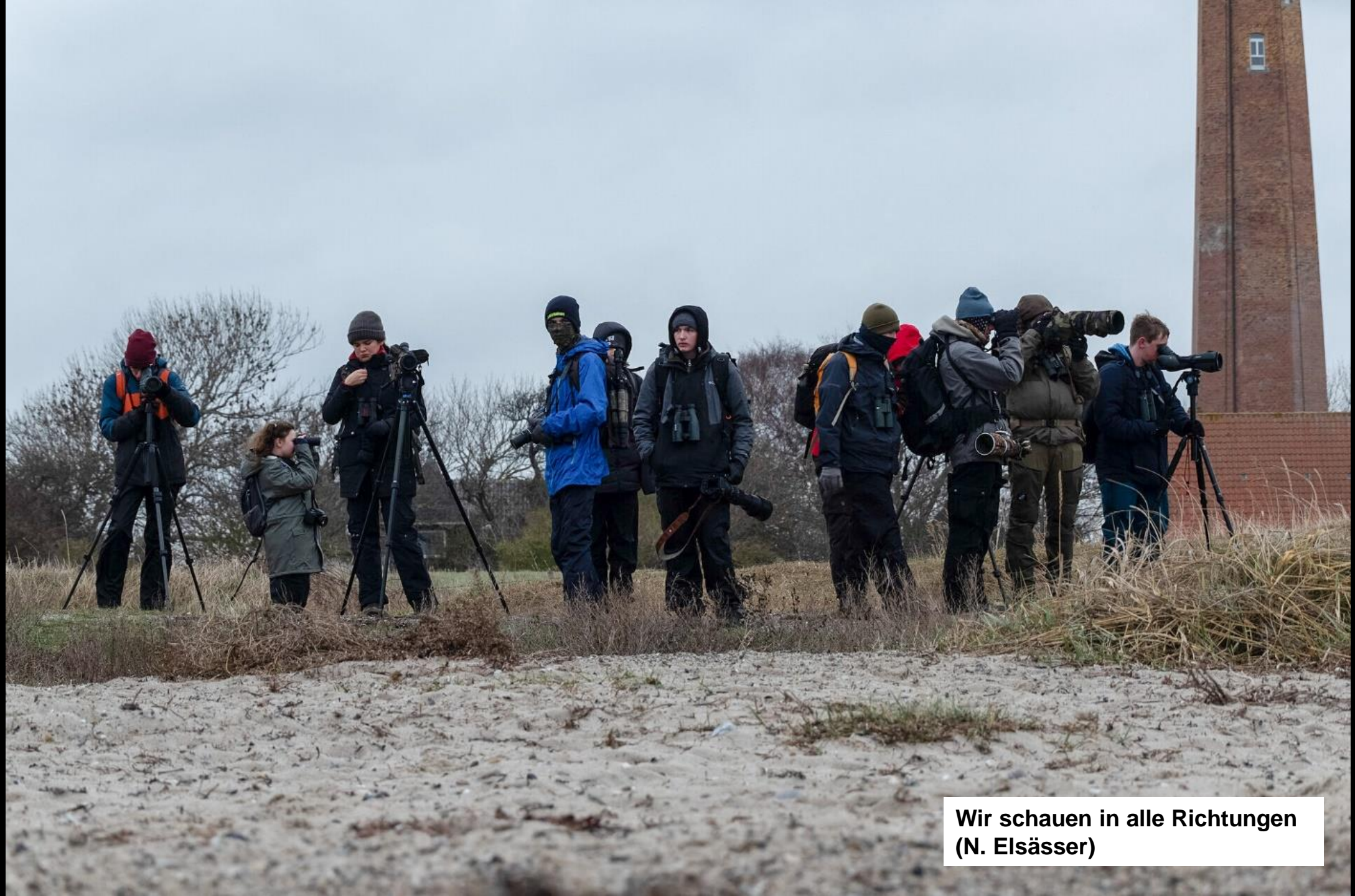
Wir schauen in alle Richtungen (N. Elsässer)