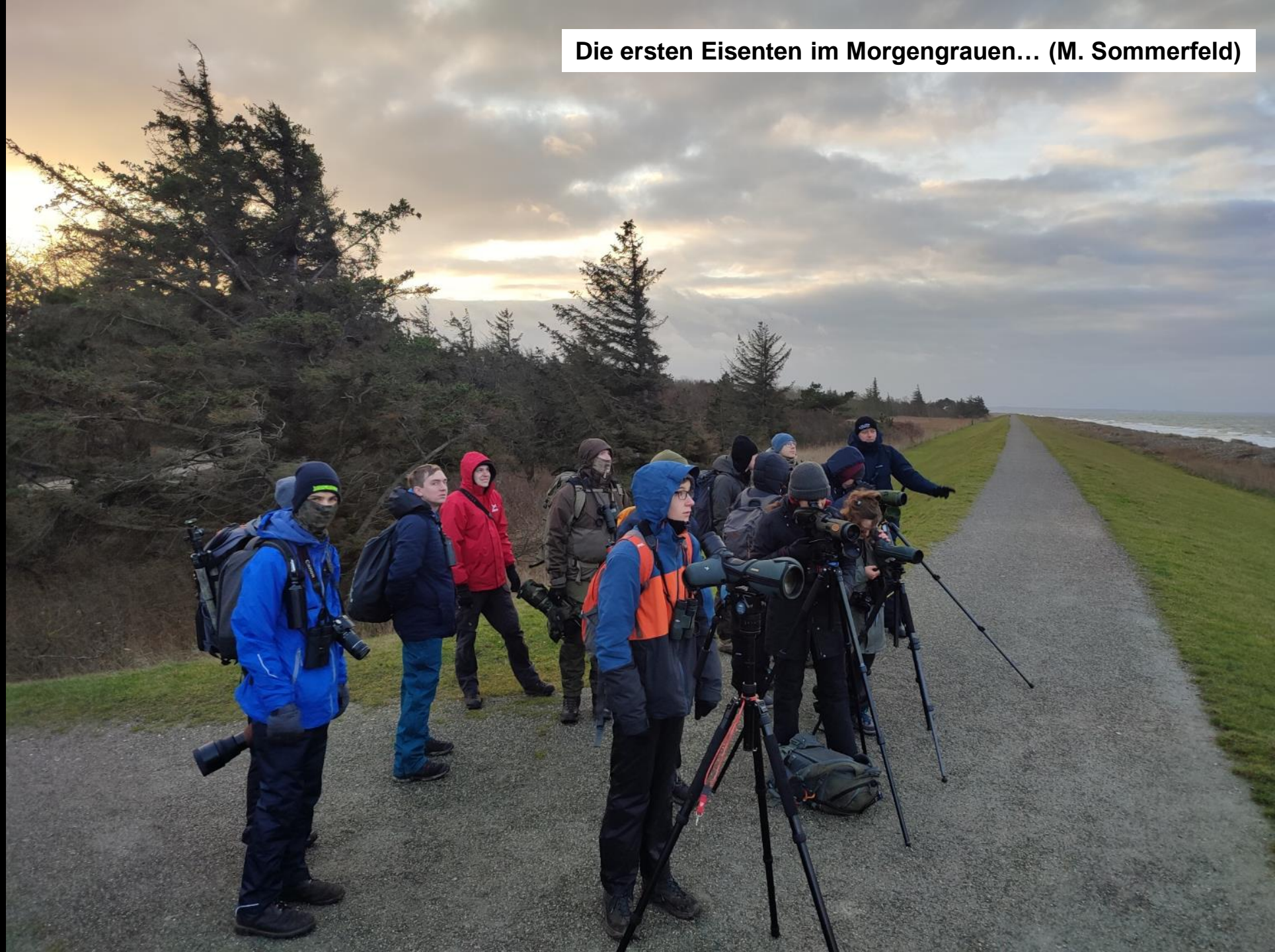
Die ersten Eisenten im Morgengrauen... (M. Sommerfeld)