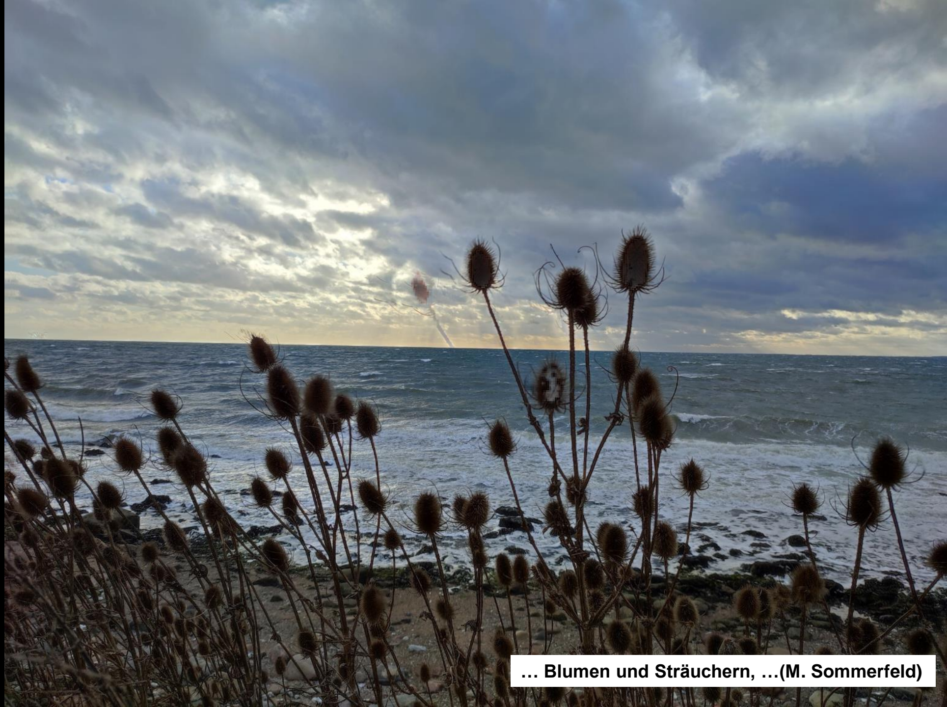
... Blumen und Sträuchern, ...(M. Sommerfeld)