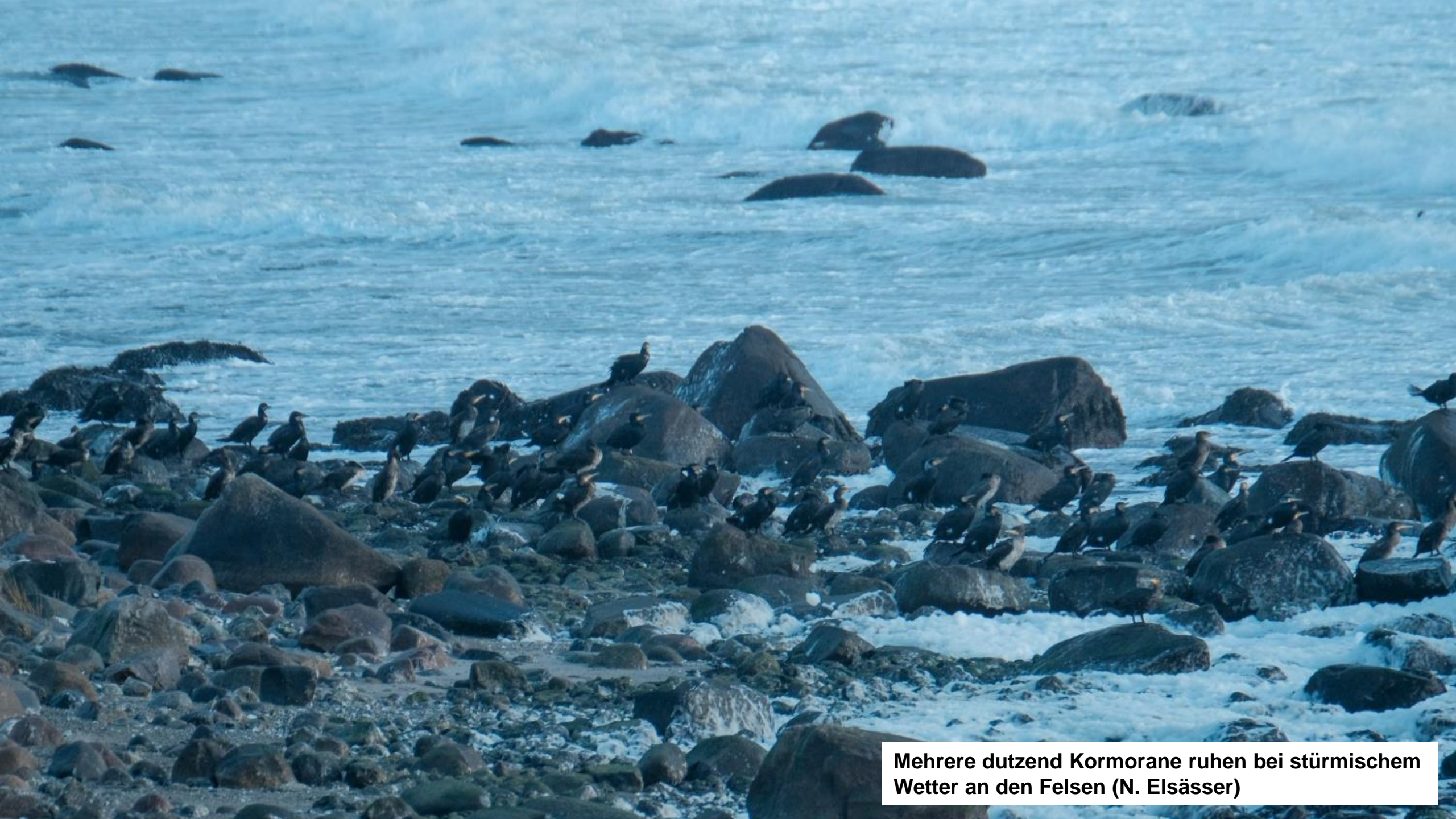
Mehrere dutzend Kormorane ruhen bei stürmischem Wetter an den Felsen (N. Elsässer)