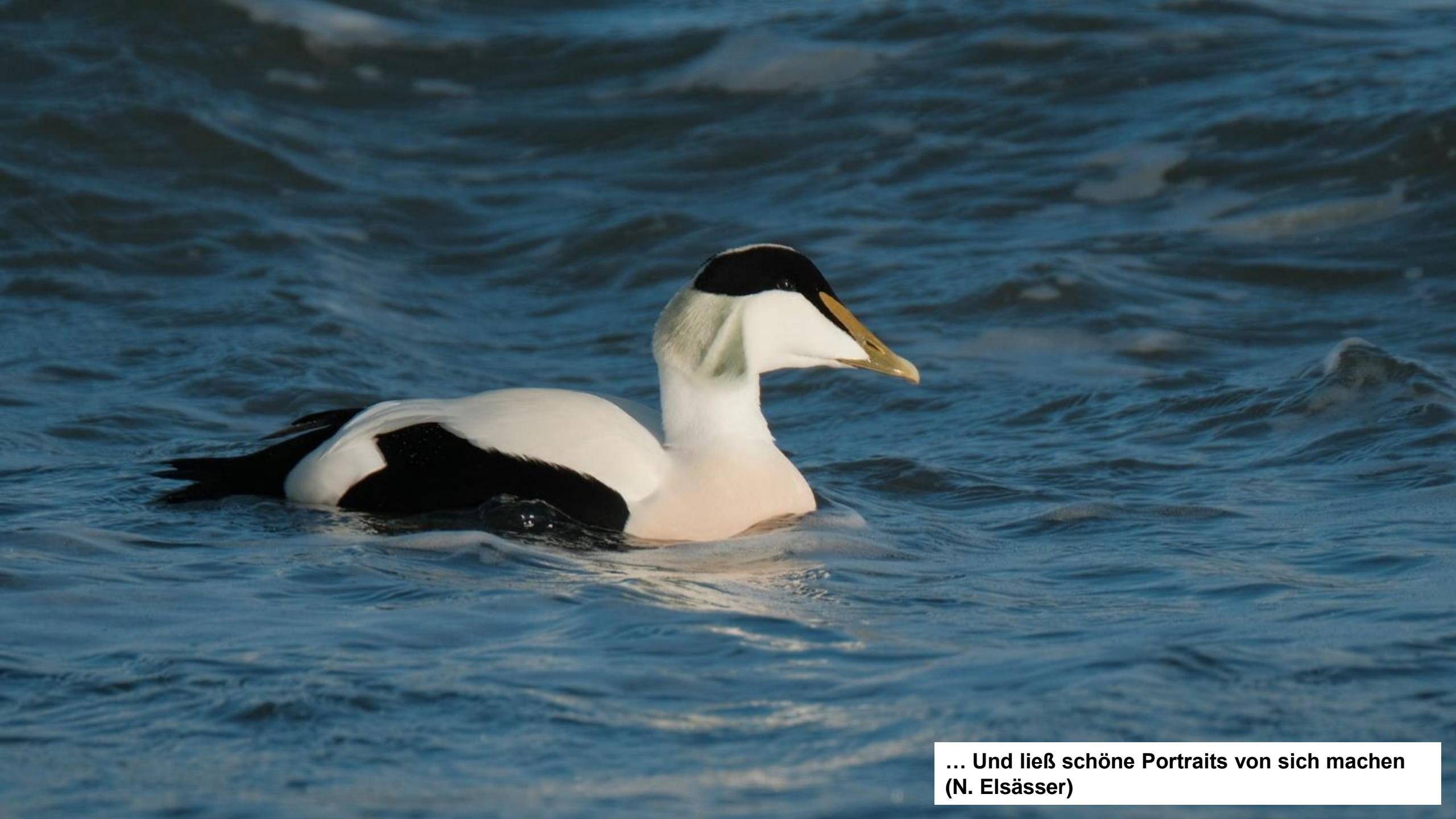
... Und ließ schöne Portraits von sich machen (N. Elsässer)