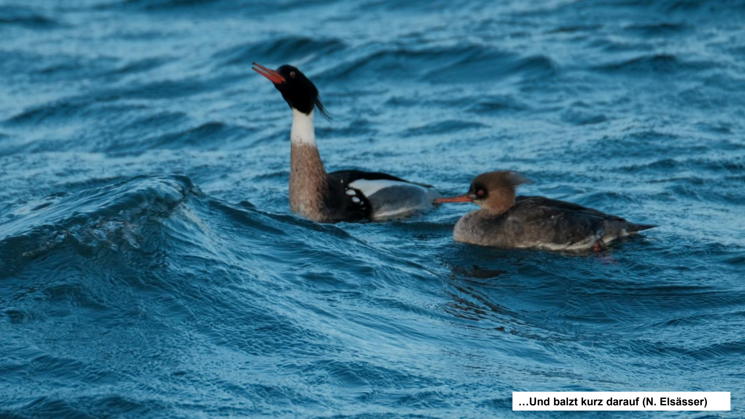
...Und balzt kurz darauf (N. Elsässer)