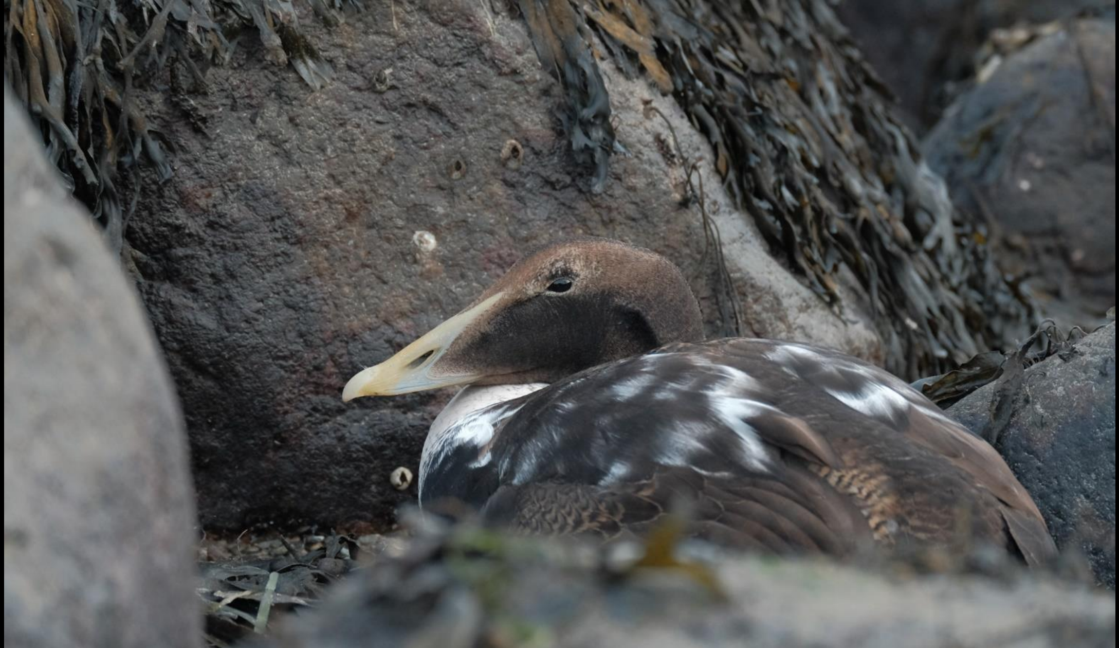
Ein schwächelndes Eiderenten-Weibchen zwischen den Felsen (N. Elsässer)