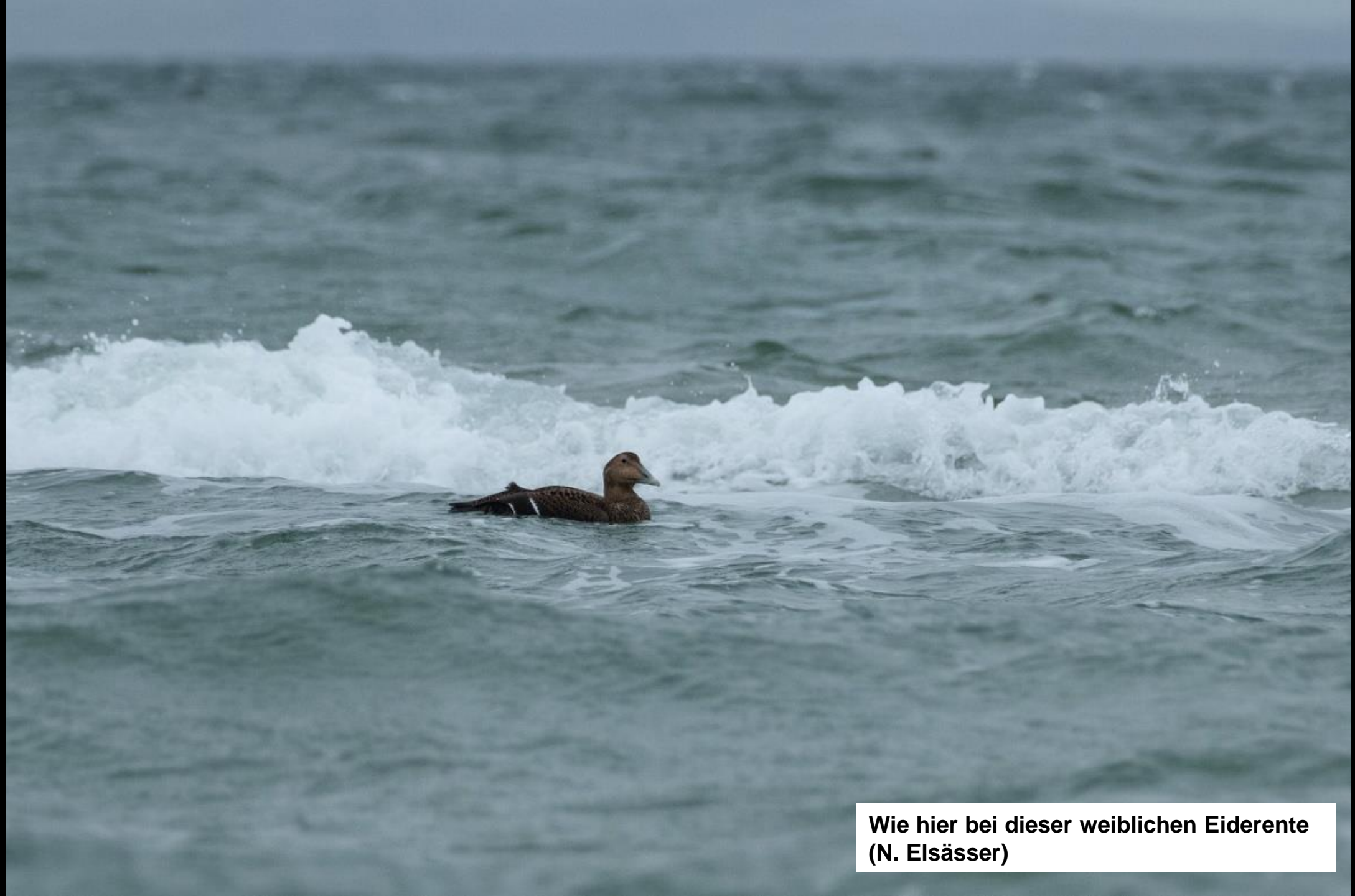
Wie hier bei dieser weiblichen Eiderente (N. Elsässer)