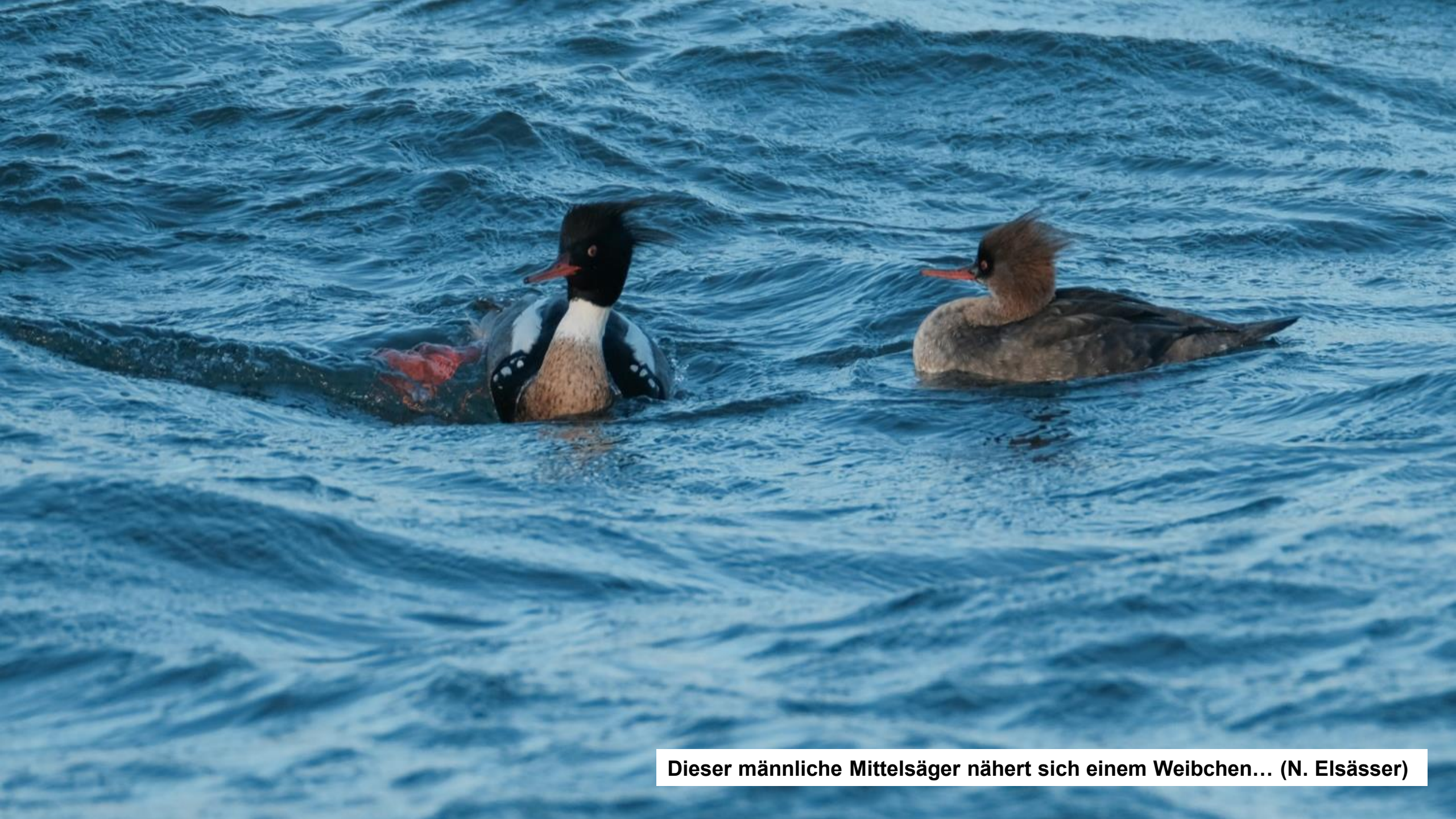
Dieser männliche Mittelsäger nähert sich einem Weibchen... (N. Elsässer)