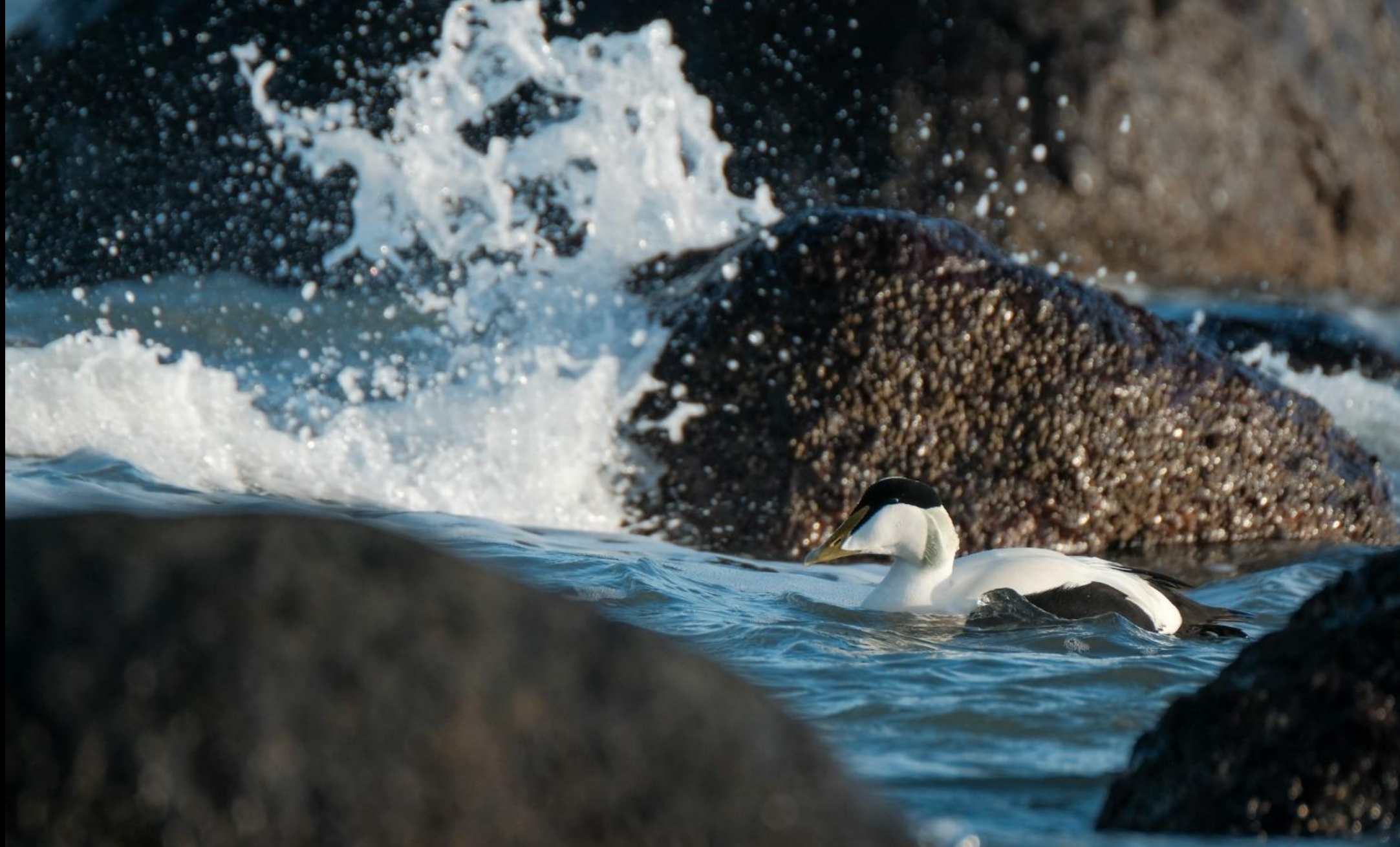
Eine Eiderente war besonders neugierig... (N. Elsässer)