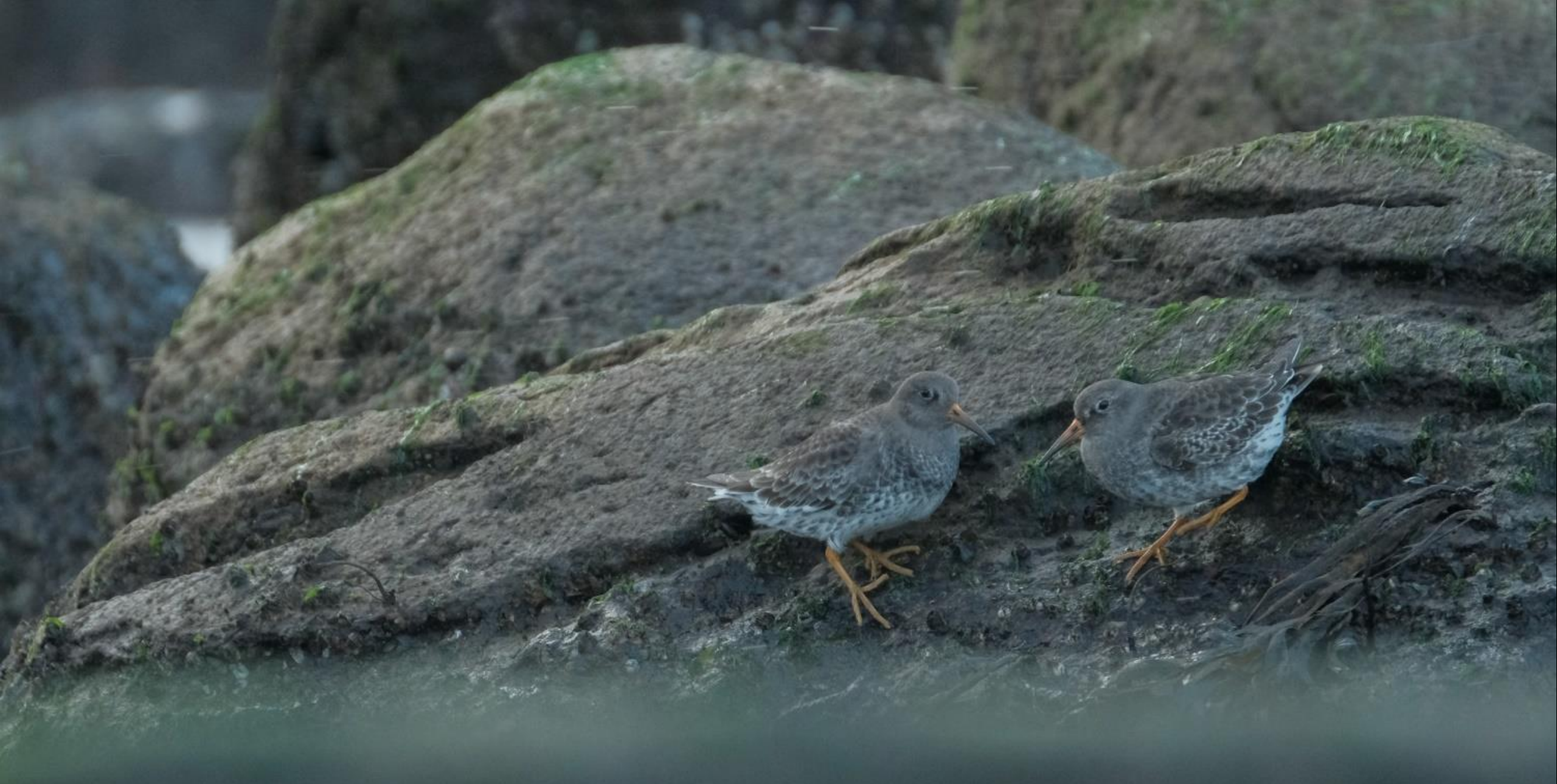
...Zwei Meerstrandläufer suchen zwischen den Felsen nach Nahrung (N. Elsässer)