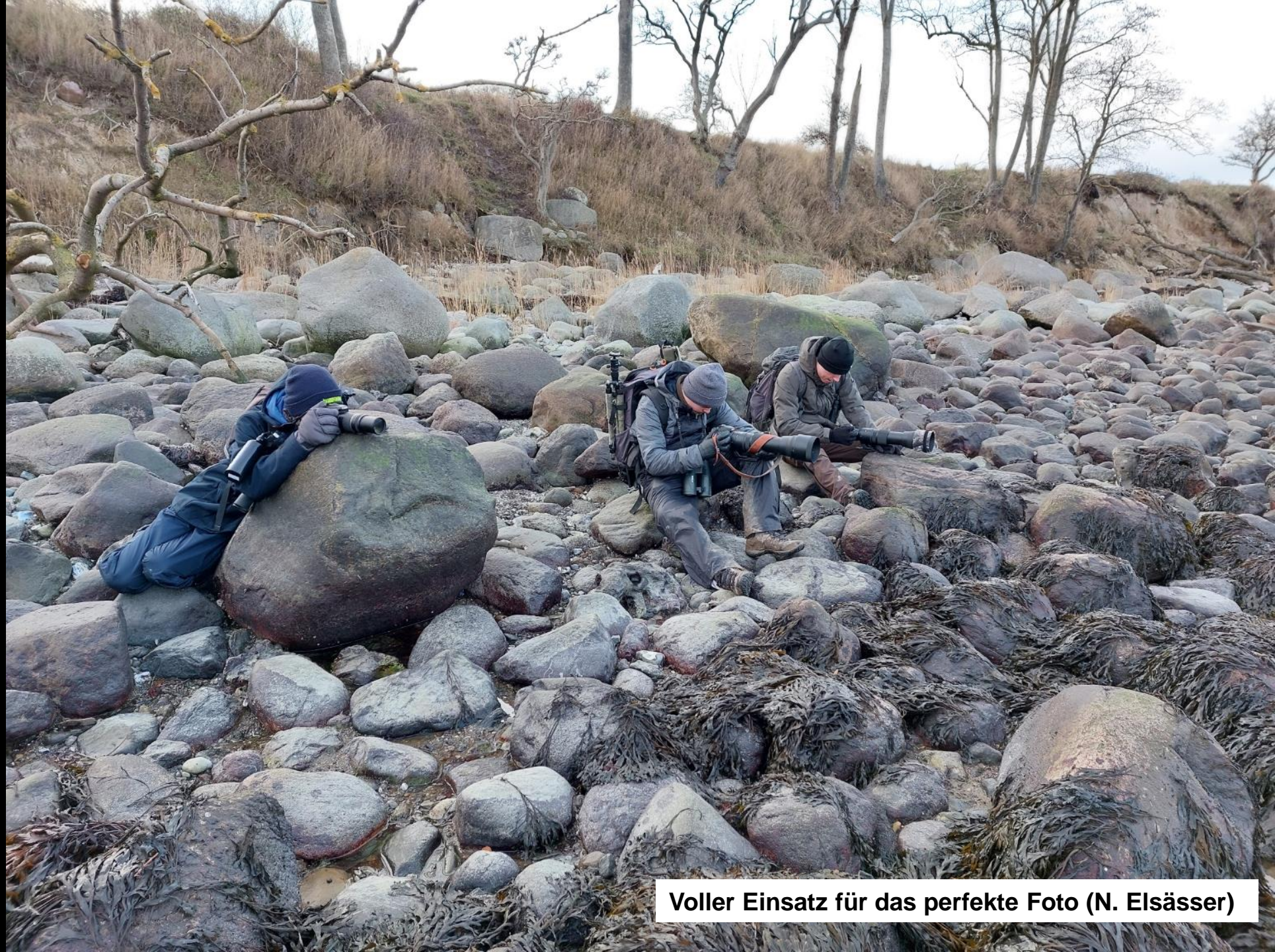
Voller Einsatz für das perfekte Foto (N. Elsässer)