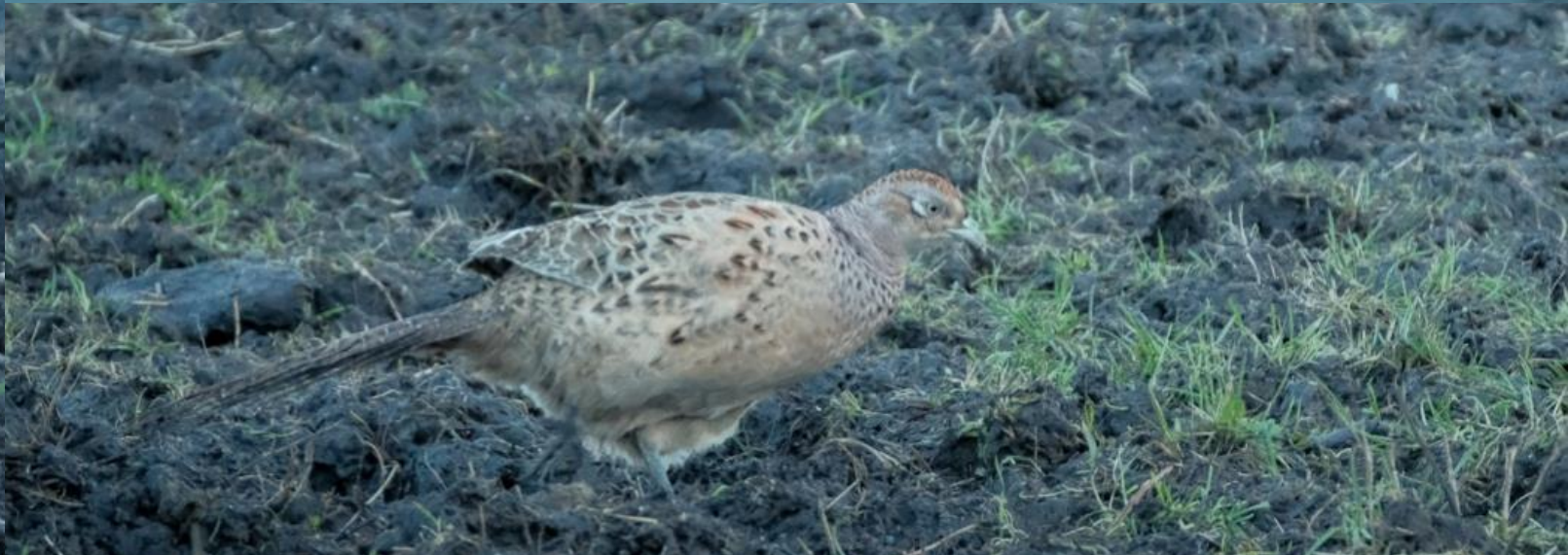
Das Federkleid von Männchen und Weibchen schimmert im Licht (N. Elsässer)