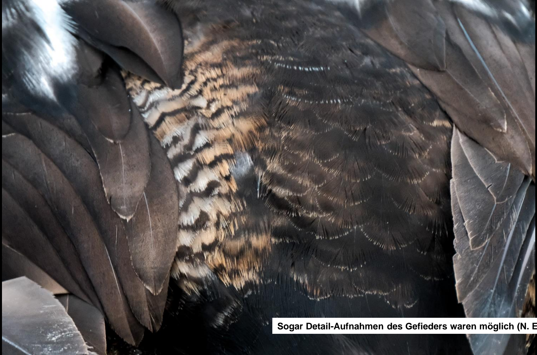
Sogar Detail-Aufnahmen des Gefieders waren möglich