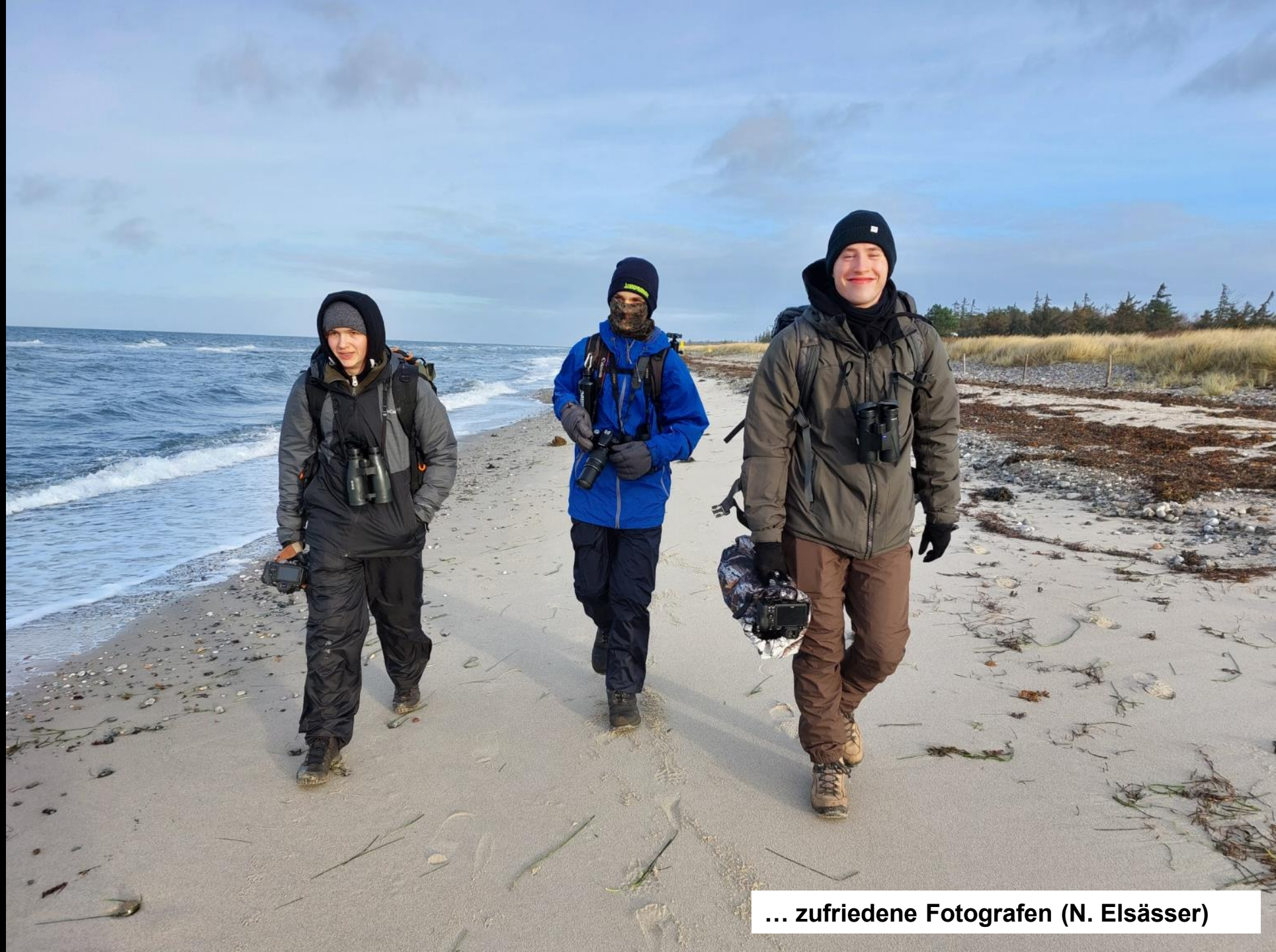
... zufriedene Fotografen (N. Elsässer)