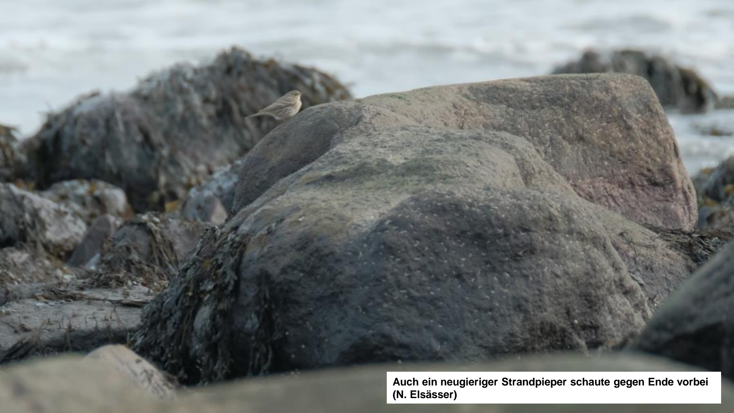
Auch ein neugieriger Strandpieper schaute gegen Ende vorbei (N. Elsässer)