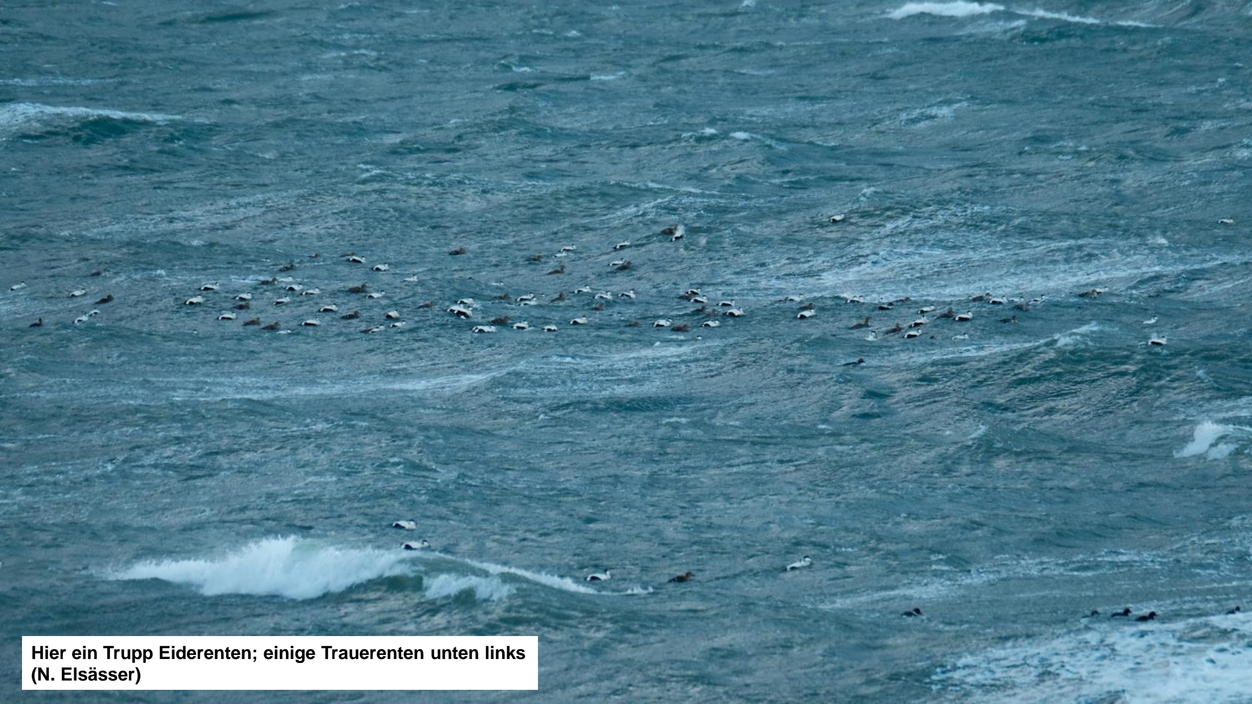
Hier ein Trupp Eiderenten; einige Trauerenten unten links (N. Elsässer)