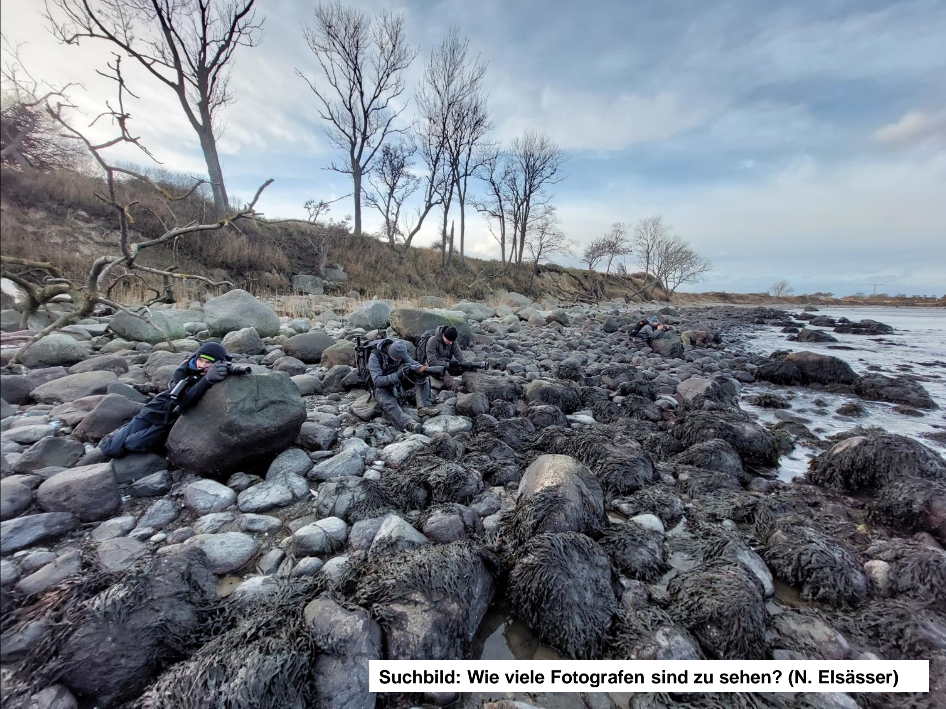
Suchbild: Wie viele Fotografen sind zu sehen? (N. Elsässer)