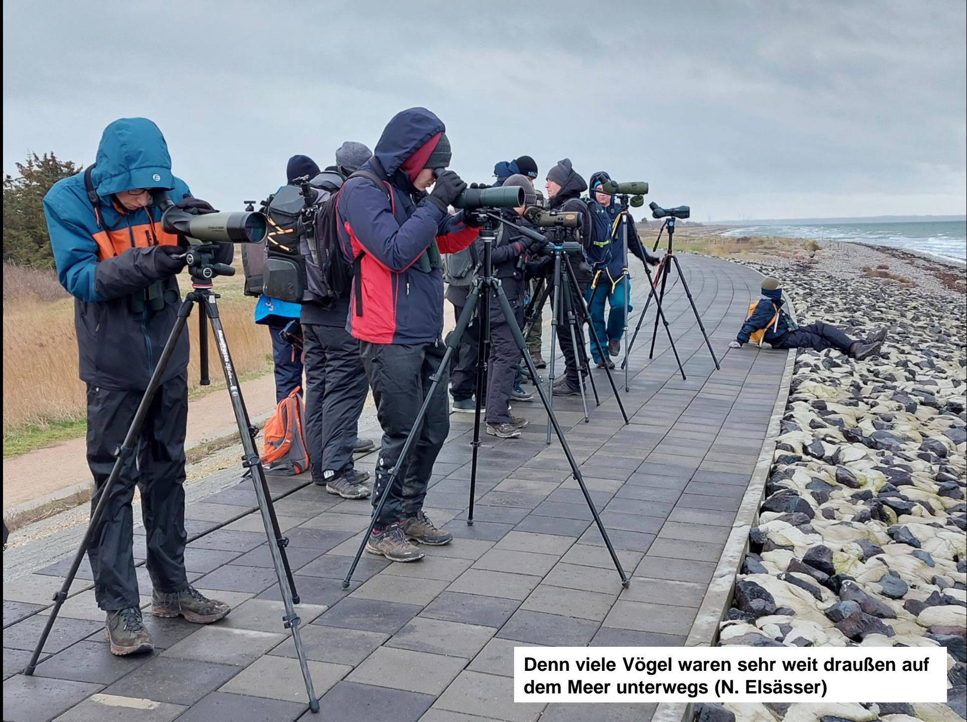
Denn viele Vögel waren sehr weit draußen auf dem Meer unterwegs (N. Elsässer)